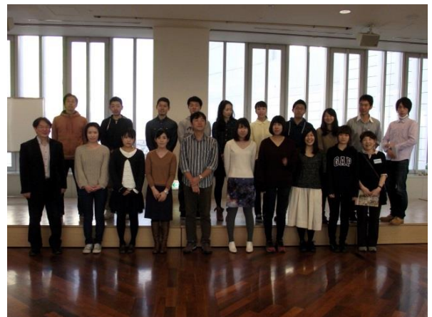
言語聴覚士、学生ボランティア