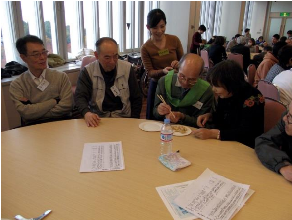
ピーナッツ・リレー