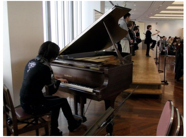
歌、リズム体操、グループ毎の交流