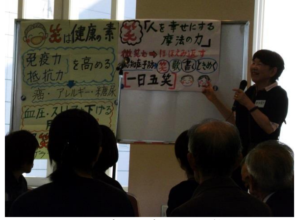
オープニング 一日五笑